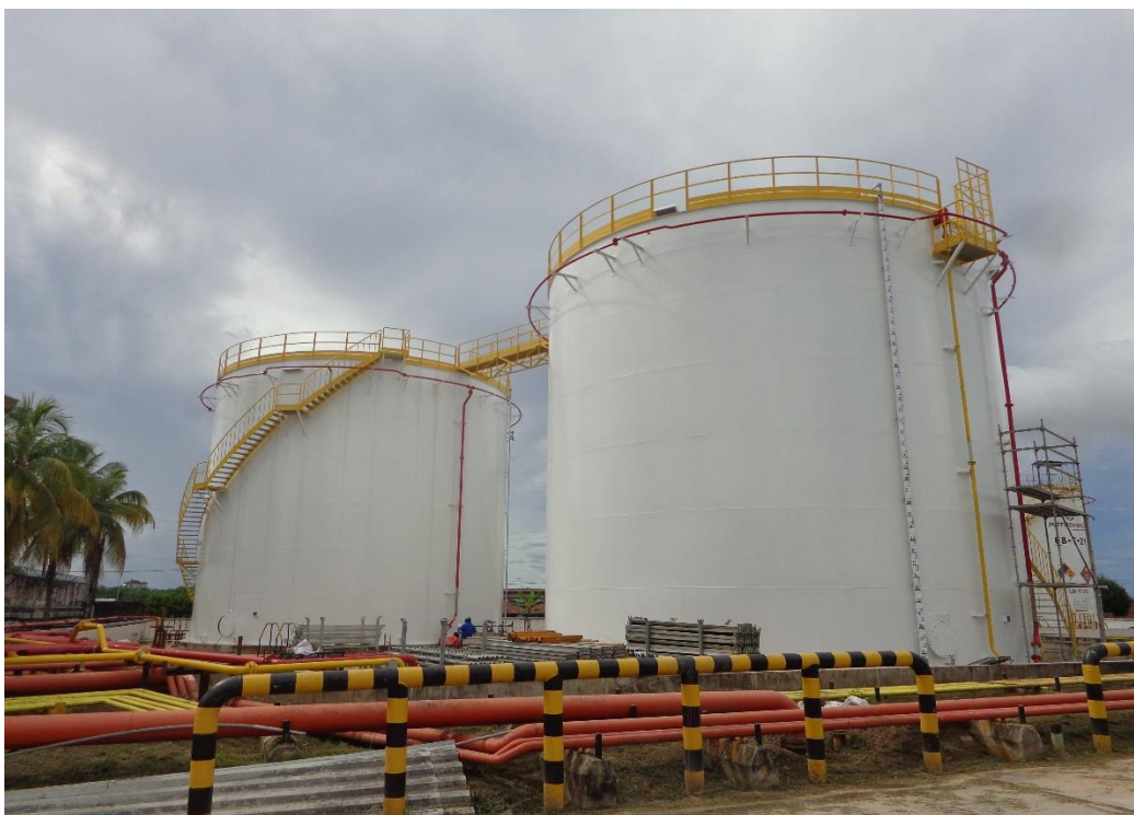
Fig. N°4: Arreglo General de Tanques.

La instalación del logo no requerirá retirar la capa de pintura de los tanques, se realizará una limpieza y de ser el caso debe ser instalado por piezas teniendo el máximo cuidado para que las uniones entre piezas se realicen sobre la plancha metálica y no sobre la sobre monta de soldaduras verticales y horizontales que pudieran encontrarse. Seguidamente se muestra los tanques instalados: