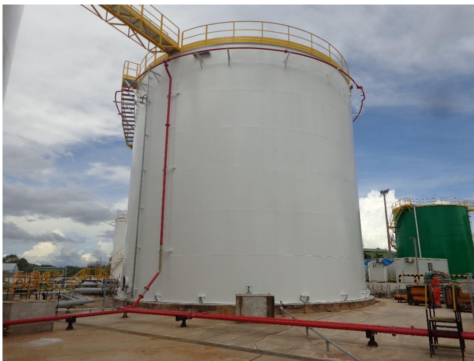
Fig. N°6: Tanque 68T-24