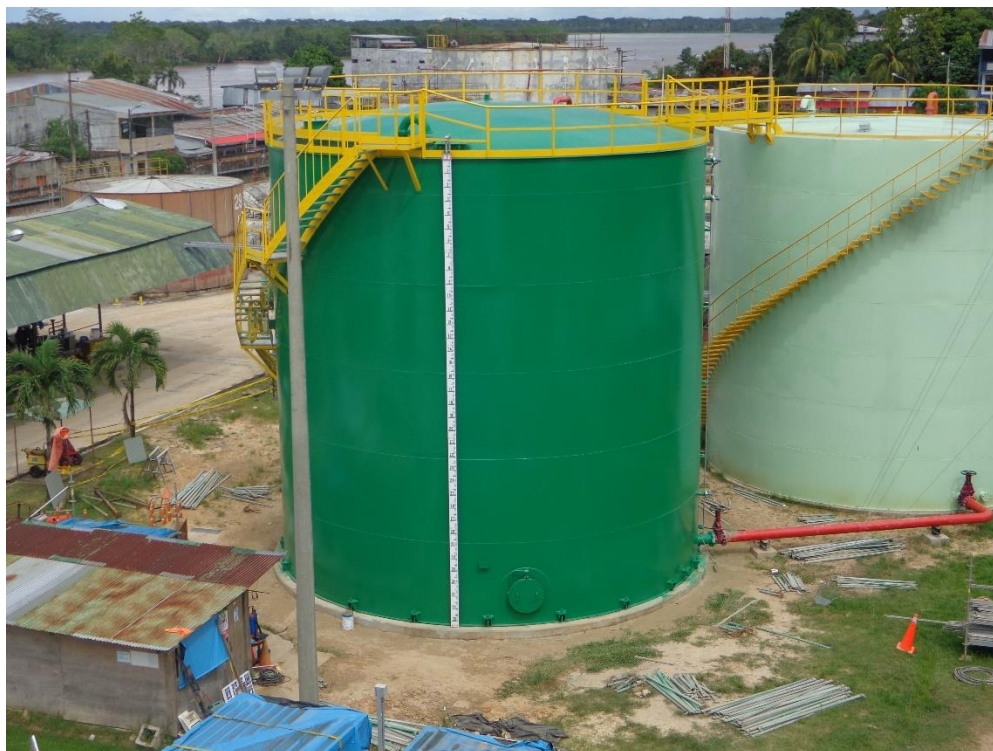
Fig. N°7: Tanque 29T-3

La administración del contrato estará a cargo de la Jefatura Proyecto de Inversión de la Gerencia Departamento Ingeniería de PETROPERÚ, la cual designará una persona (supervisor y/o inspector) para la supervisión directa del contrato.