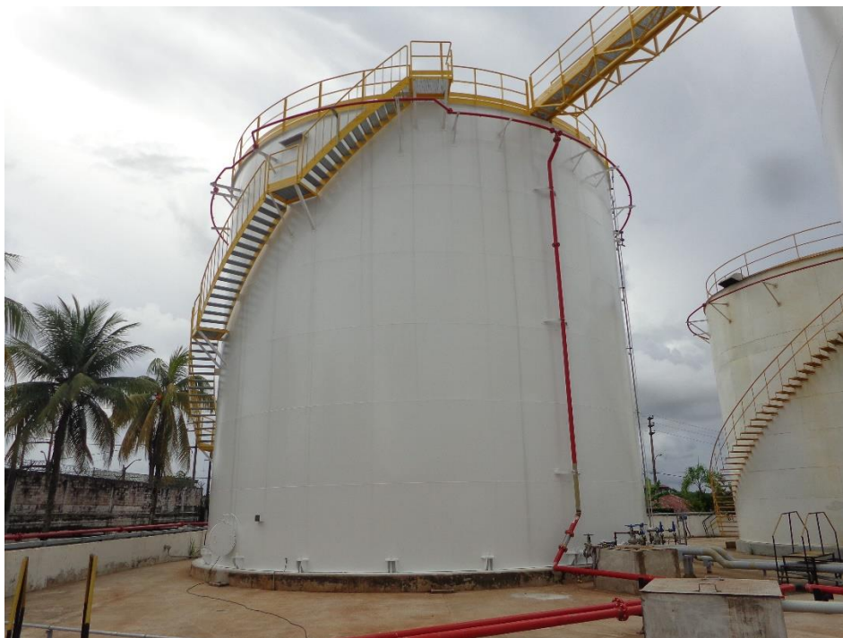
Fig. N°5: Tanque 68T-23